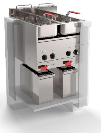
Avec les commandes incorporées