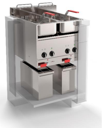
Met ingebouwde bedieningen